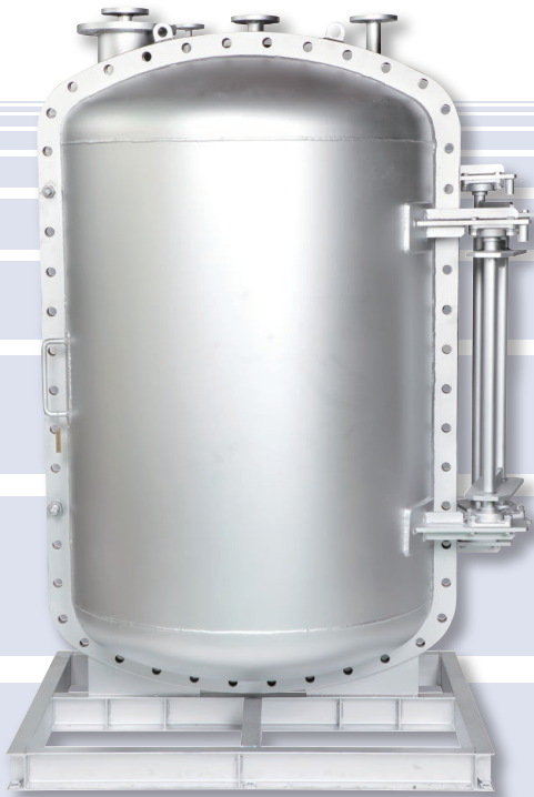
ガスバルブユニット Gas Valve Unit

Vignis-mini, Oil/Gas Combination Burners for LNG Fueled vessel, has four types of burners as its product line-up. The types of Vignis-mini cover the range of "Oil combustion 90kg/h - 250kg/h" and "Gas combustion 74kg/h - 206 kg/h".